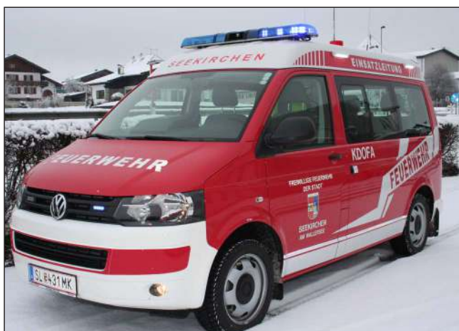
Taktische Bezeichnung: KDOFA Aufbaufirma: Dlouhy