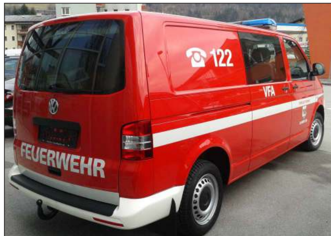
Fahrgestell: VW T5 Kastenwagen Abnahme: 24.01.2014 in der LFS Salzburg