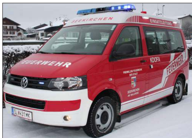
Fahrgestell: VW T5, 4- Motion Abnahme: 09.12.2014 in der LFS Salzburg