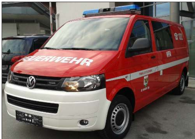
Taktische Bezeichnung: VFA 1 Aufbaufirma: Vierthaler