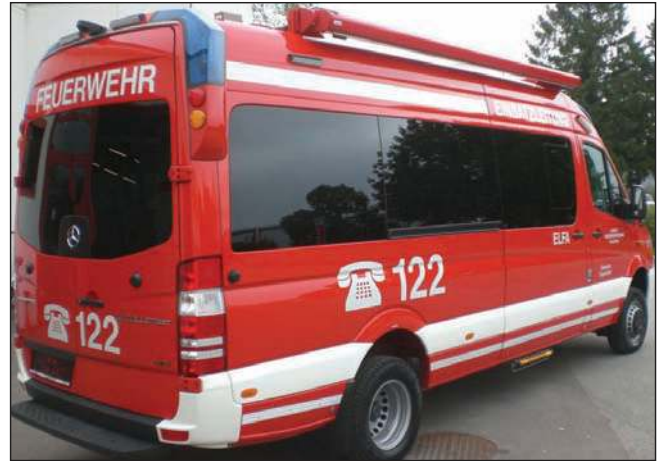
Fahrgestell: Mercedes Sprinter 519 CDI 4x4 Abnahme: 03.09.2014 bei der Firma Dlouhy in Tulln