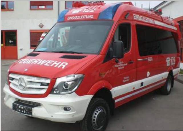
Taktische Bezeichnung: ELF Aufbaufirma: Dlouhy