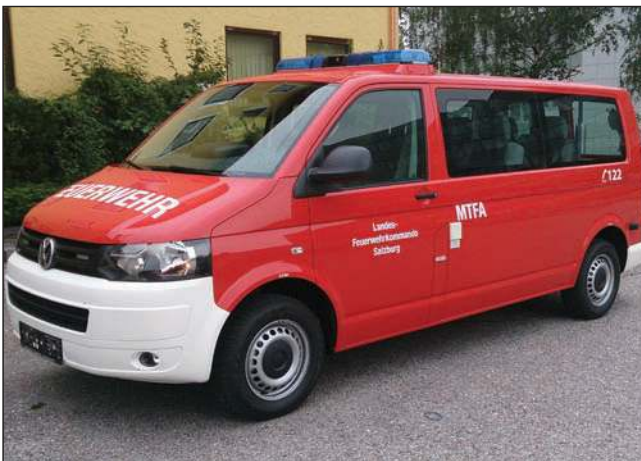
Taktische Bezeichnung: MTFA Aufbaufirma: BBG und Fa. Porsche Wr. Neustadt