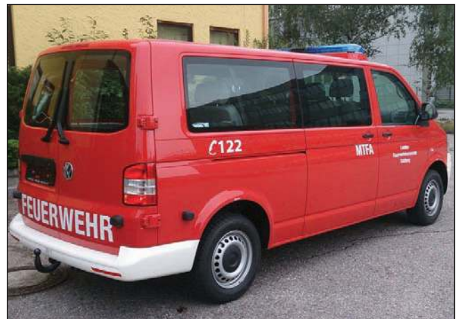
Fahrgestell: VW T5 Abnahme: 10.09.2014 bei der Fa. Porsche Wr. Neustadt