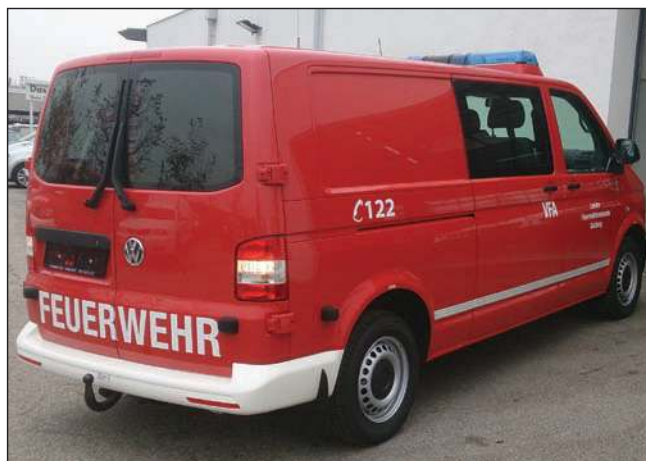
Fahrgestell: VW T5 Abnahme: 30.10.2014 bei der Fa. Porsche Wr. Neustadt