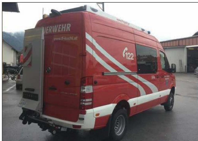
Fahrgestell: Mercedes Sprinter 519 CDI Abnahme: 03.10.2014 im LFV-Salzburg