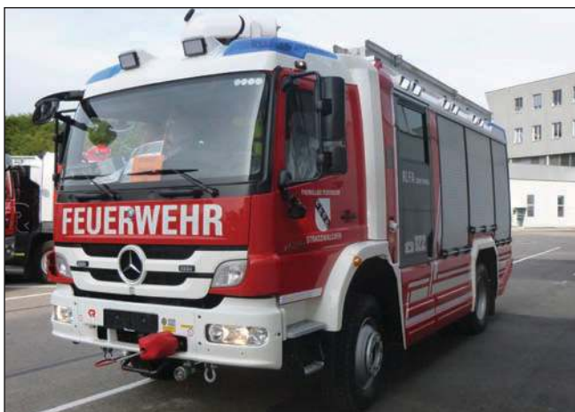
Taktische Bezeichnung: RLFA 2000 Tunnel Aufbaufirma: Rosenbauer