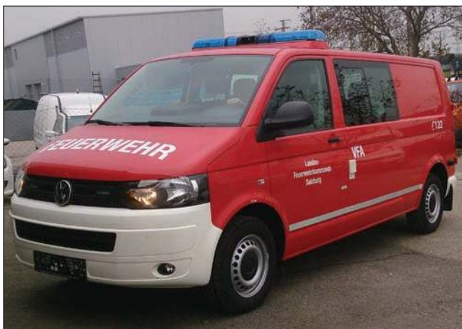
Taktische Bezeichnung: VFA Aufbaufirma: BBG und Fa. Porsche Wr. Neustadt