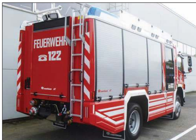
Fahrgestell: Mercedes Atego 1629 AF Abnahme: 13.10.2014 bei der Fa. Rosenbauer