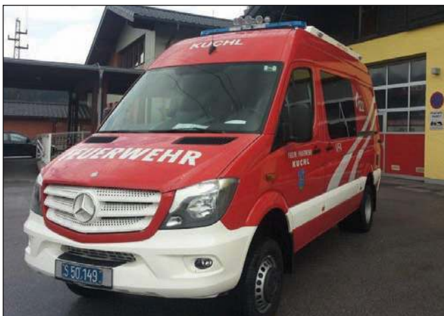
Taktische Bezeichnung: VFA Aufbaufirma: Seiwald