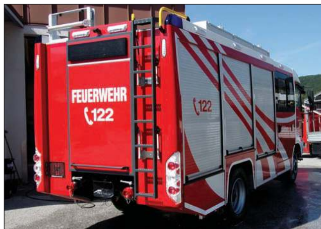
Fahrgestell: MAN 15.290 Abnahme: 20.05.2015 bei der Fa. Seiwald