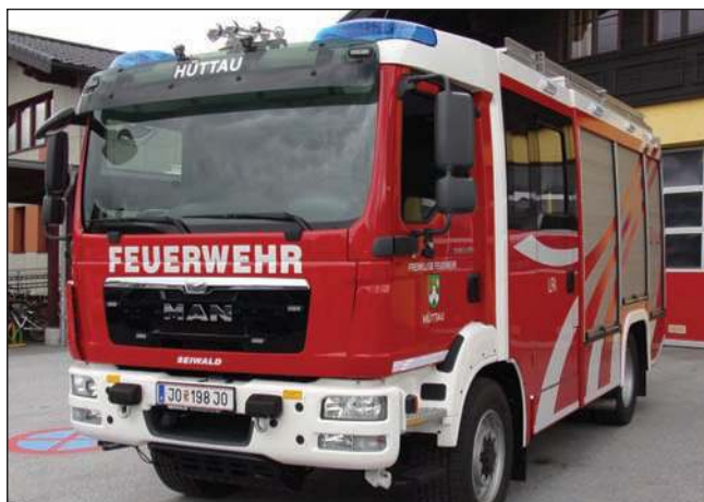
Taktische Bezeichnung: LFA Aufbaufirma: Fa. Seiwald