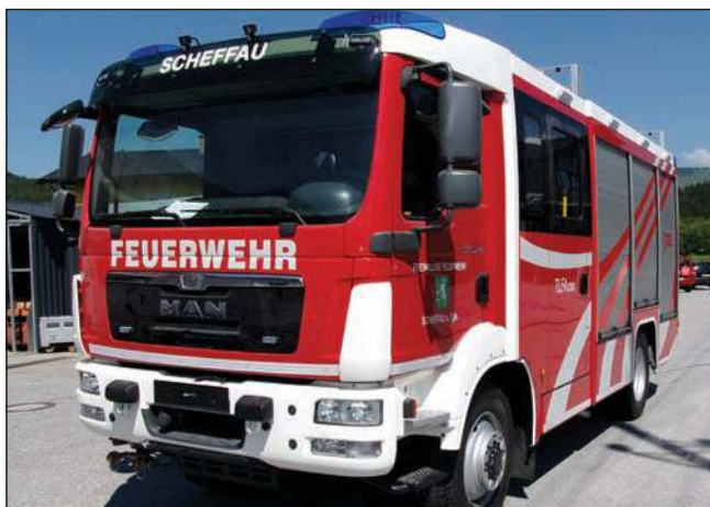
Taktische Bezeichnung: TLFA 2000 Aufbaufirma: Fa. Seiwald