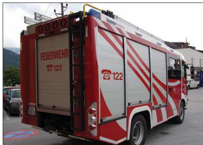
Fahrgestell: MAN 13.290 Abnahme: 20.05.2015 bei der Fa. Seiwald