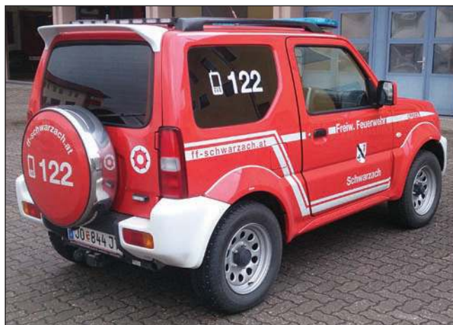
Fahrgestell: Suzuki Jimny Abnahme: 27.11.2015 im LFV Salzburg