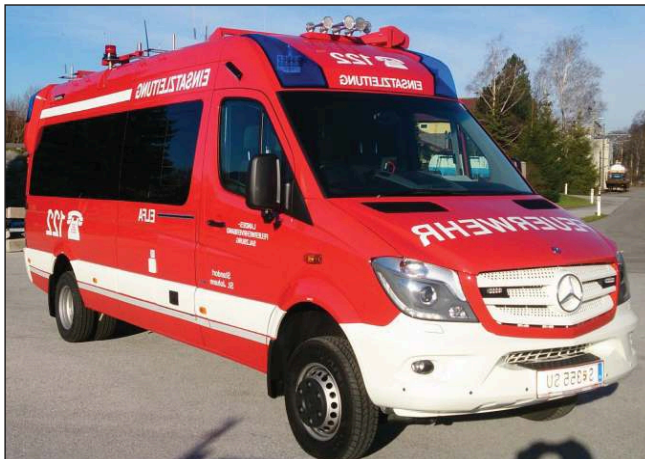
Taktische Bezeichnung: ELFA Aufbaufirma: Fa. Dlouhy