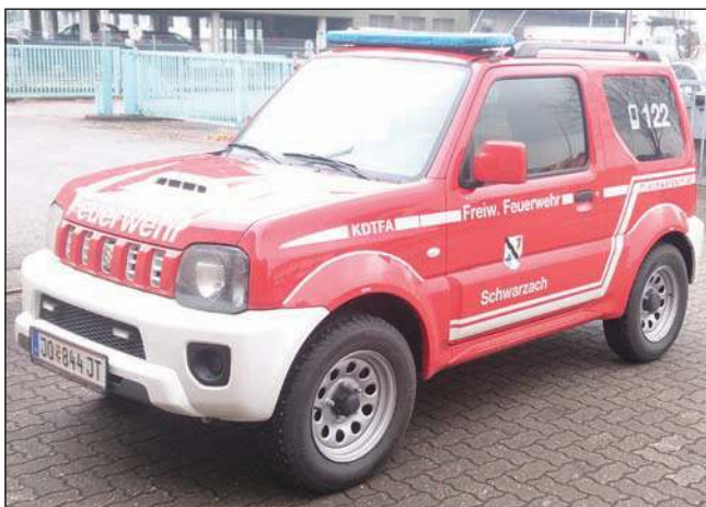
Taktische Bezeichnung: KDTFA Aufbaufirma: Eigenaufbau