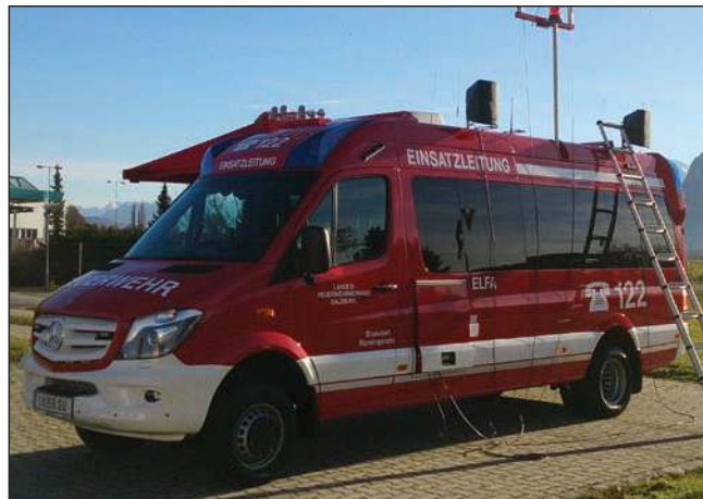
Fahrgestell: Mercedes Sprinter 519 CDI 4x4 Abnahme: 24.11.2015 bei der Fa. Dlouhy Tulln