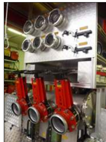
Taktische Bezeichnung: HLPA Aufbaufirma: Seiwald / Burbach