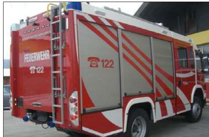
Taktische Bezeichnung: TLFA 3000 Aufbaufirma: Seiwald