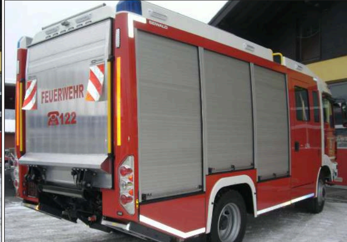
Fahrgestell: MAN TGM 13.290 4 x 4 Abnahme: 23.01.2013 bei der Fa. Seiwald