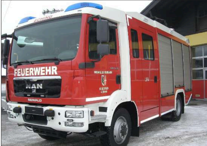
Taktische Bezeichnung: LFA Aufbaufirma: Seiwald