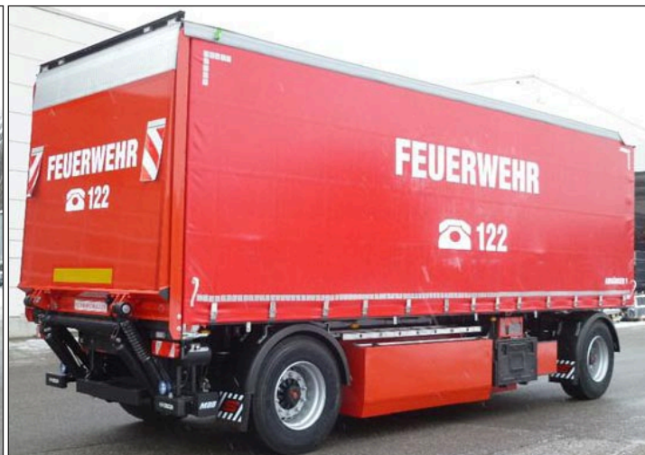
Fahrgestell: 2 Achs Schiebepalen- Plateauanhänger Abnahme: 18.01.2013 bei der Fa. Schwarzmüller