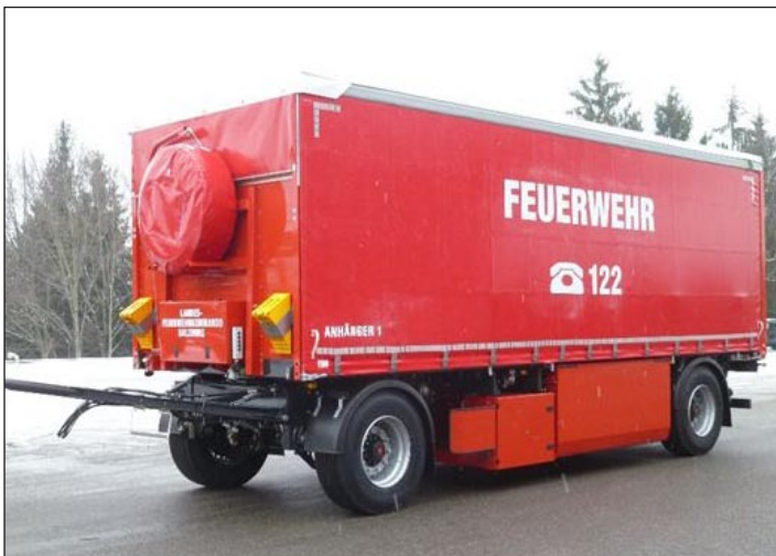
Taktische Bezeichnung: KAT- Anhänger Aufbaufirma: Schwarzmüller