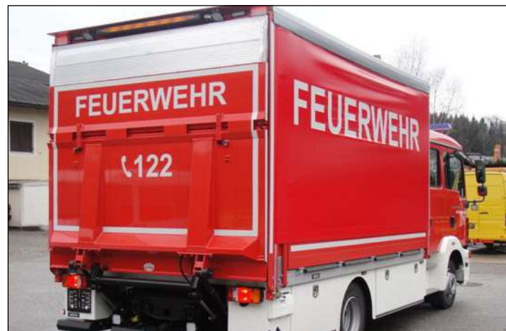
Fahrgestell: MAN TGL 10.220 4 x 2 Abnahme: 12.01.2012 in der LFS Salzburg