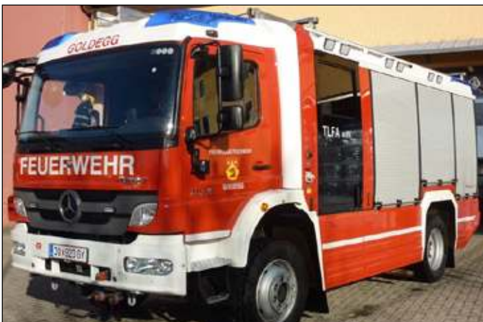
Taktische Bezeichnung: TLFA 4000 Aufbaufirma: Rosenbauer