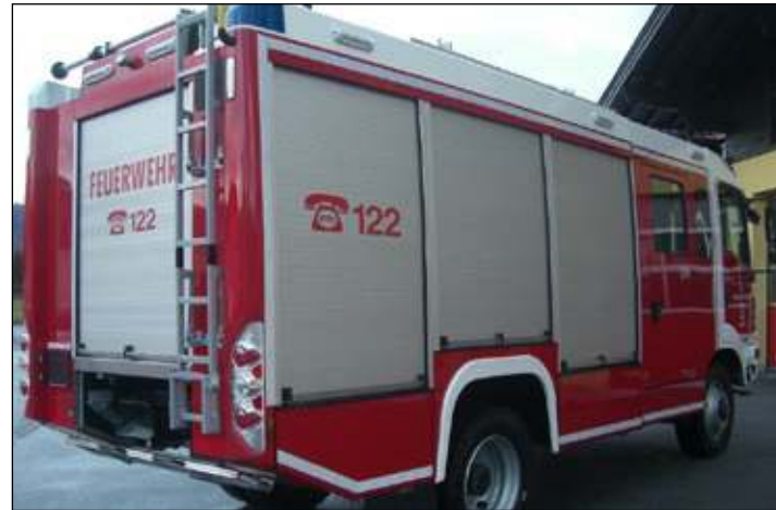
Fahrgestell: MAN 13.250 4 x 4 Abnahme: 11.01.2012 bei der Fa. Seiwald