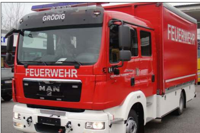
Taktische Bezeichnung: VF 2 Aufbaufirma: Eberl Salzburg