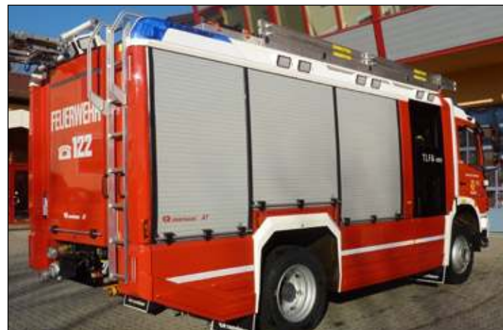
Fahrgestell: Mercedes 1629 AF Abnahme: 12.01.2012 in der LFS Salzburg