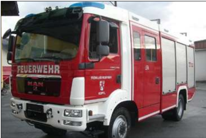
Taktische Bezeichnung: LFA Aufbaufirma: Seiwald