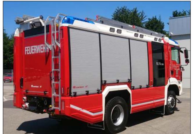
Fahrgestell: MAN TGM 18.340 4x4 Abnahme: 22.06.2016 bei der Fa. Rosenbauer