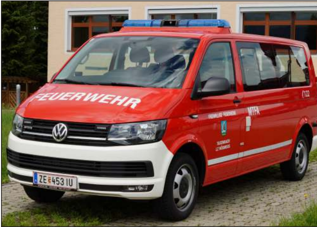
Taktische Bezeichnung: MTFA Aufbaufirma: Fa. Porsche Wiener Neustadt / BBG