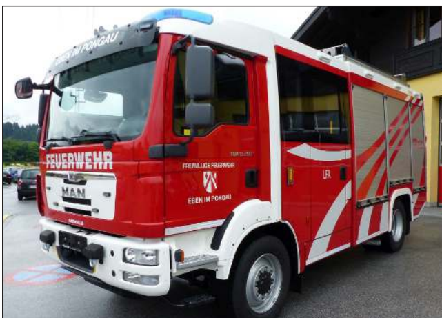
Taktische Bezeichnung: LFA Aufbaufirma: Fa. Seiwald