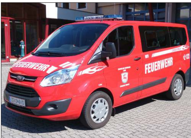
Taktische Bezeichnung: MTF Aufbaufirma: Eigenaufbau