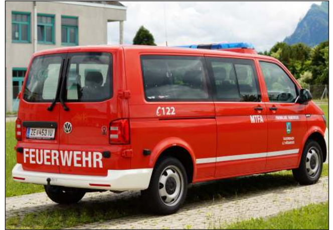
Fahrgestell: VW T6 Abnahme: 02.06.2016 beim LFV Salzburg