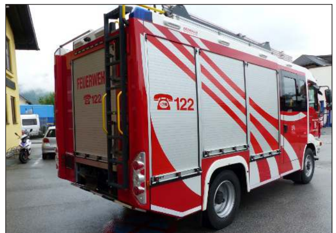
Fahrgestell: MAN TGM 13.290 Abnahme: 29.06.2016 bei der Fa. Seiwald