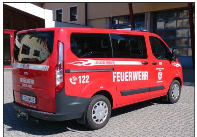
Fahrgestell: Ford Transit Abnahme: 25.06.2016 beim LFV Salzburg