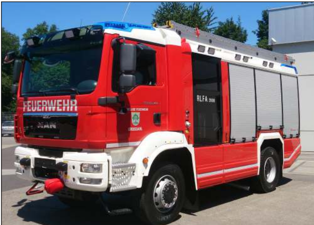
Taktische Bezeichnung: RLFA 2000 Aufbaufirma: Fa. Rosenbauer