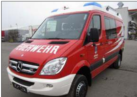
Taktische Bezeichnung: KLFA Aufbaufirma: Rosenbauer