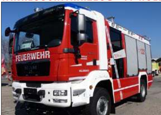
Taktische Bezeichnung: TLFA 3000 Aufbaufirma: Rosenbauer