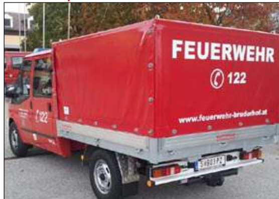
Fahrgestell: Ford Transit Abnahme: 17.10.2012 und 15.03.2013 beim LFV Salzburg