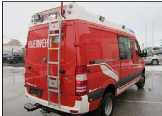
Fahrgestell: Mercedes Sprinter 519 CDI 4 x 4 Abnahme: 06.03.2013 bei der Fa. Rosenbauer