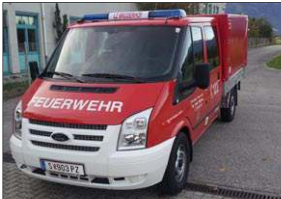
Taktische Bezeichnung: VFA Aufbaufirma: Lagermax / Wuppinger