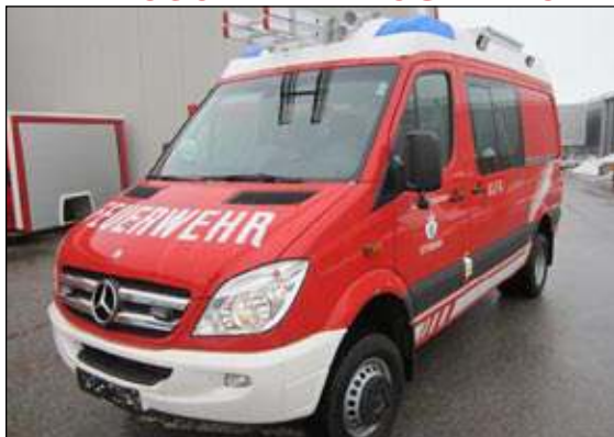
Taktische Bezeichnung: KLFA Aufbaufirma: Rosenbauer