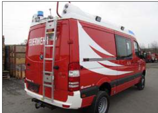
Fahrgestell: Mercedes Sprinter 519 CDI 4 x 4 Abnahme: 18.03.2013 bei der Fa. Rosenbauer