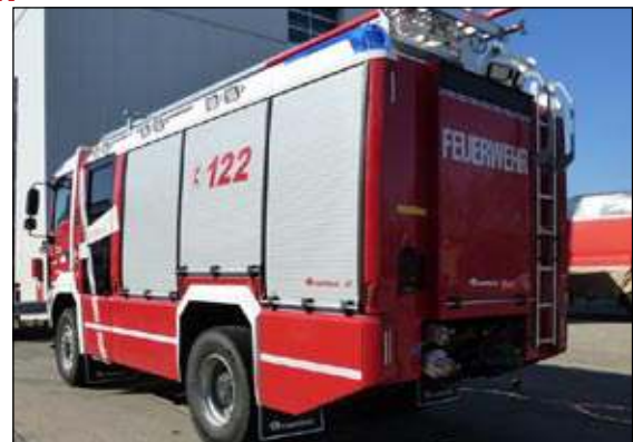
Fahrgestell: MAN 18.340 4 x 4 TGM Abnahme: 06.03.2013 bei der Fa. Rosenbauer