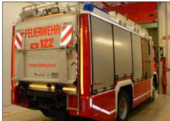
Fahrgestell: Mercedes 1429 AF Abnahme: 15.03.2013 bei der Fa. Rosenbauer