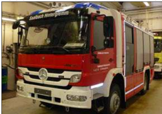
Taktische Bezeichnung: LFA Aufbaufirma: Rosenbauer