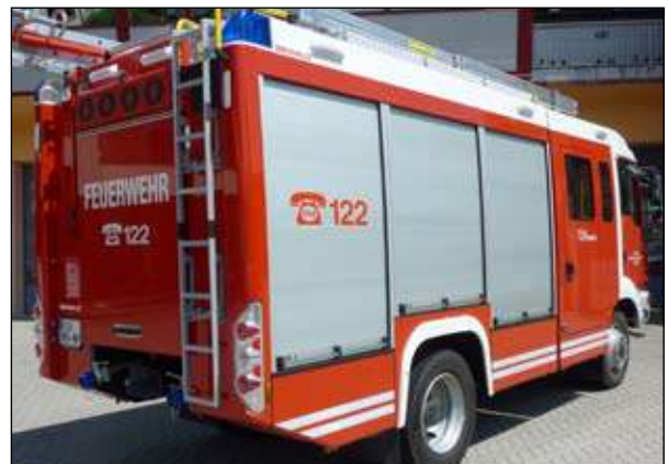
Fahrgestell: MAN TGM 15.290 Abnahme: 26. Mai in der LFS Salzburg