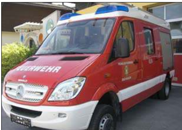
Taktische Bezeichnung: KLFA Aufbaufirma: Seiwald