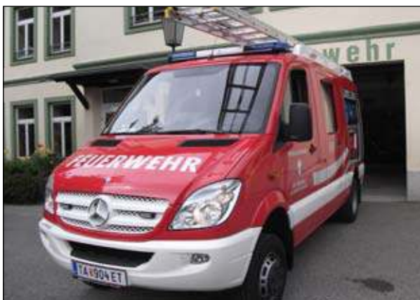
Taktische Bezeichnung: KLFA Aufbaufirma: Seiwald