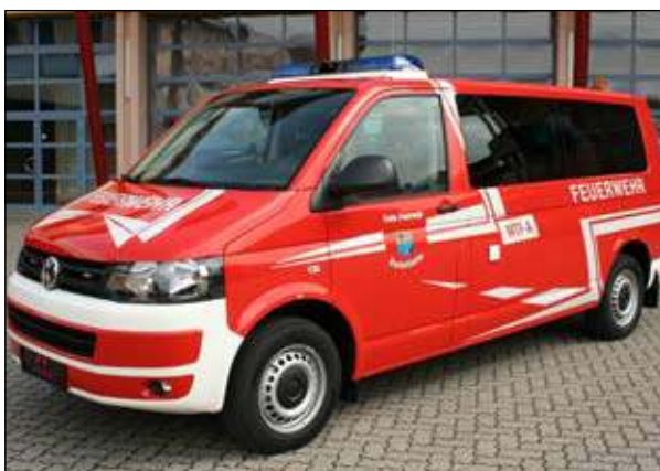
Taktische Bezeichnung: MTF Aufbaufirma: Seiwald