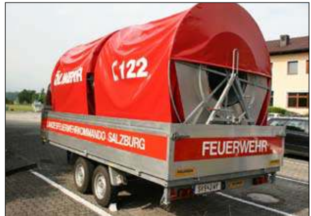
Fahrgestell: Ablinger Doppelachsanhänger Abnahme: 02. Mai bei der Fa. Rosenbauer / Leonding