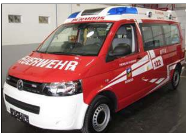
Taktische Bezeichnung: MTF Aufbaufirma: Rosenbauer