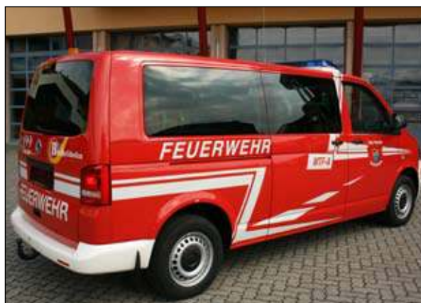
Fahrgestell: VW T 5 Abnahme: 04. Mai in der LFS Salzburg