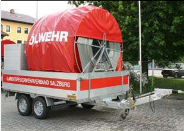
Taktische Bezeichnung: Ölsperre Tamsweg Aufbaufirma: Ablinger / Rosenbauer / Optimal