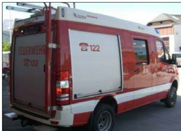
Fahrgestell: Mercedes 519 CDI Abnahme: 27. Mai in der LFS Salzburg