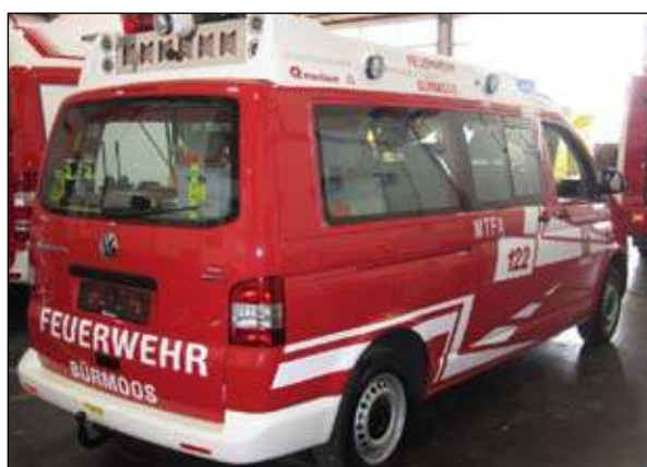
Fahrgestell: VW T 5 Abnahme: 04. Mai in der LFS Salzburg