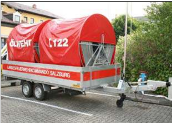
Taktische Bezeichnung: Ölsperre St. Gilgen LZ Abersee Aufbaufirma: Ablinger / Rosenbauer / Optimal