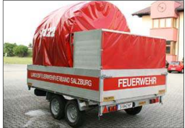
Fahrgestell: Ablinger Doppelachsanhänger Abnahme: 02. Mai bei der Fa. Rosenbauer / Leonding