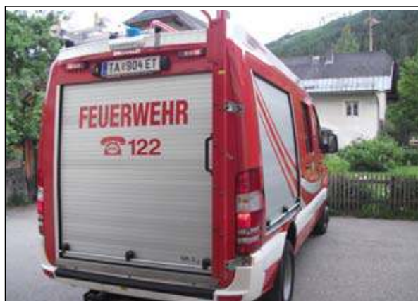
Fahrgestell: Mercedes 519 CDI Abnahme: 27. Mai in der LFS Salzburg