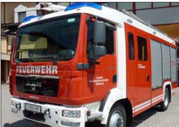
Taktische Bezeichnung: TLFA 3000 Aufbaufirma: Seiwald