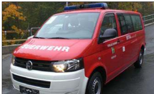
Taktische Bezeichnung: MTFA Aufbaufirma: Iveco Magirus