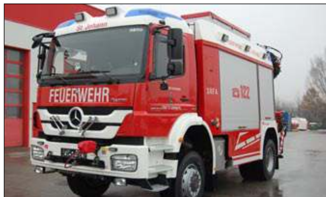
Taktische Bezeichnung: SRFA Aufbaufirma: Rosenbauer