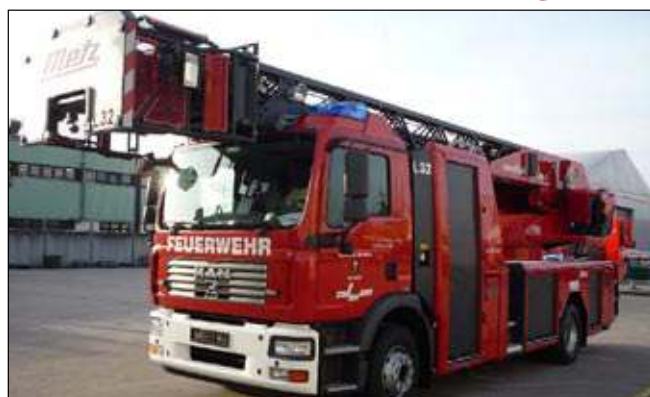
Taktische Bezeichnung: DLA (K) 23-12 Aufbaufirma: Metz / Rosenbauer