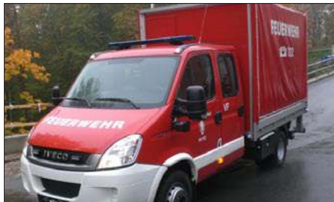
Taktische Bezeichnung: VF 1 Aufbaufirma: Iveco Magirus