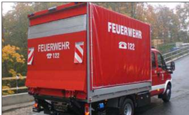
Fahrgestell: Iveco Daily 65 C 17 D Abnahme: 02.11.2011 in der LFS Salzburg