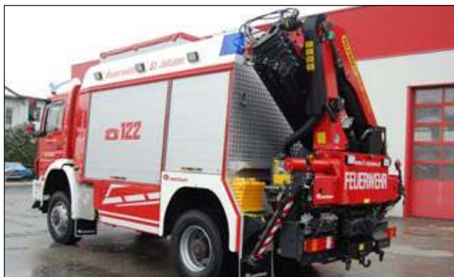
Fahrgestell: Mercedes Benz Axor 1833 AK Abnahme: 18.11.2011 bei der Fa. Rosenbauer