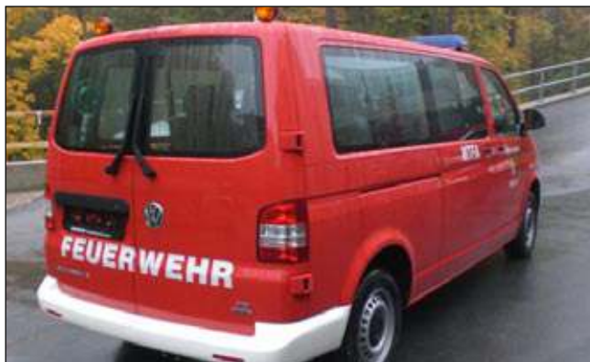
Fahrgestell: VW T5 7 HC Kombi Abnahme: 02.11.2011 in der LFS Salzburg