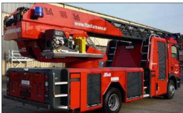
Fahrgestell: MAN TGM 15.280 4x2 BL Abnahme: 15.11.2011 bei der Fa. Metz