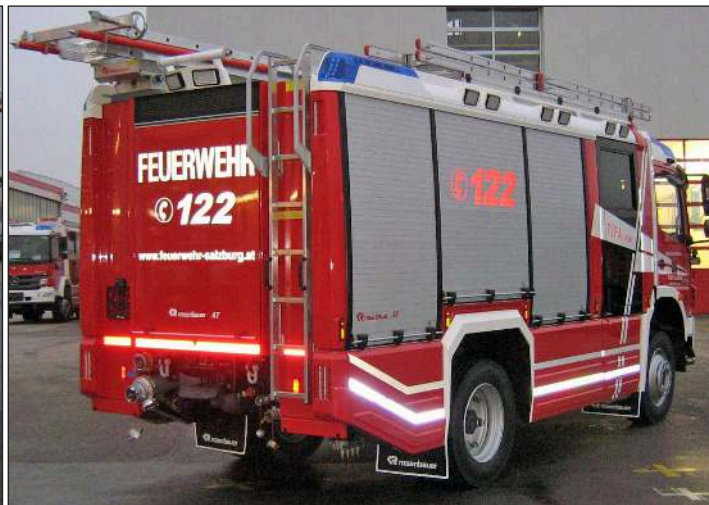
Fahrgestell: Mercedes 1629 AF Abnahme: 29.11.2012 bei der Fa. Rosenbauer