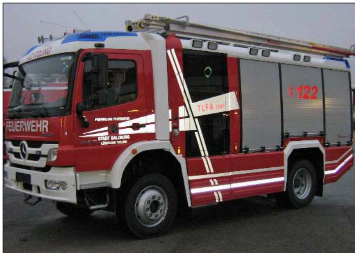
Taktische Bezeichnung: TLFA 3000 Aufbaufirma: Rosenbauer